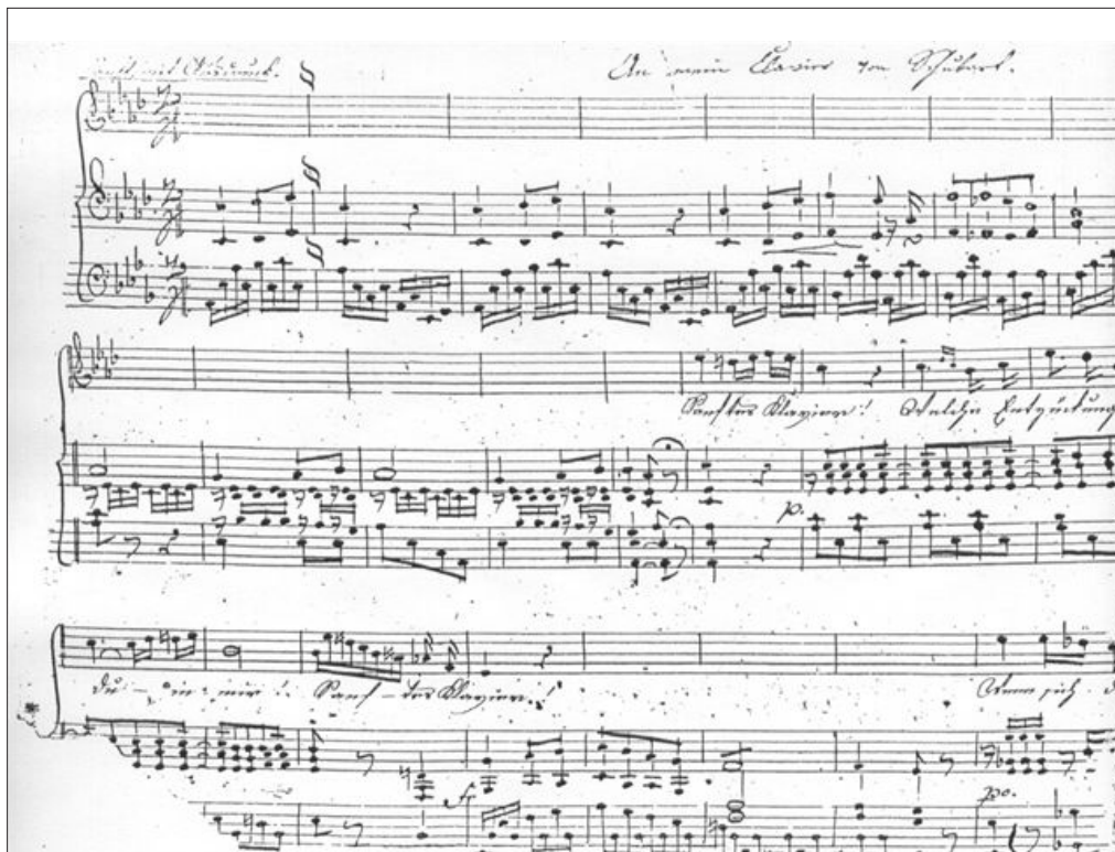
Die erste Seite der Handschrift An mein Clavier nach dem Gedicht von Christian Friedrich Daniel Schubart.

ein Thema erteilte, worüber er ein Meisterstück momentaner Erfindung aus sich hervorschief und die Zufriedenheit der Zuhörer aufs höchste steigerte. 21